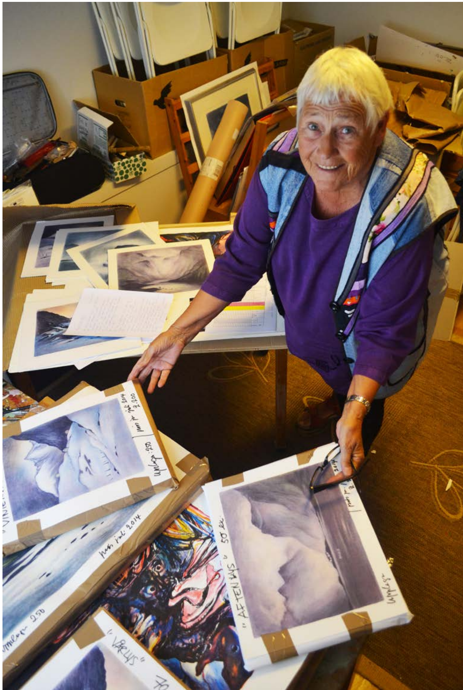
Donerer bort: Disse litografiene til en verdi på rundt en million kroner gis bort til Amnesty.