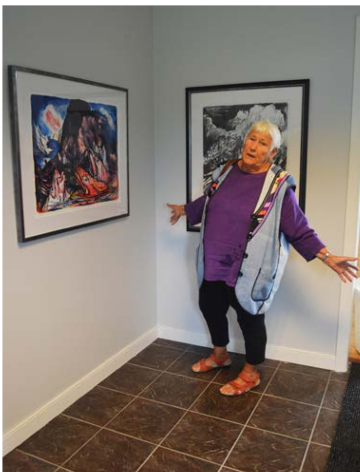
Litografier: Dette torskemaleriet gies til Amnesty.