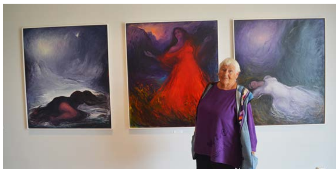
Tennes Kaspara: Johanssons mesterverk bestående av tre bilder av den legendariske Kaspara trenger et sted å henge.

seres, så planlegger Amnesty en utstilling i Tromsø før bilder sendes ned til Oslo. Inntektene skal brukes til å støtte Amnestys videre arbeid internasjonalt med menneskerettigheter.